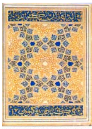
تصویر (۱۰) قرآن، قرن هفتم، خط و تذهیب عبدالله بن محمد همدانی، قاهره، کتابخانه ملی