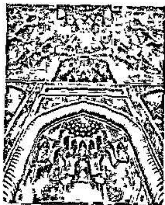
۸. نظامی گنجوی

نام «الله» بیش از همه نام‌های خدا در قرآن آمده است، و بیش از